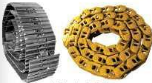
الهيكل السفلي الكامل