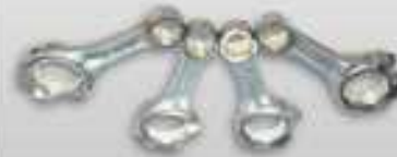
الوزن نوعية صب

our product crankshaft are all forging, good quality and long service life.