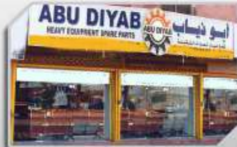
فروع الكاتريبلر - الرياض CATERPILLAR RIYADH BRANCH