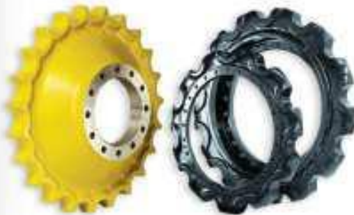
التروس ، الدواليب ، الشرائح

The product range of track and carrier rollers cover a wide variety of crawler machines available in the market e.g. Dozers, Loaders, Excavators, mini-excavators and special applications machines.