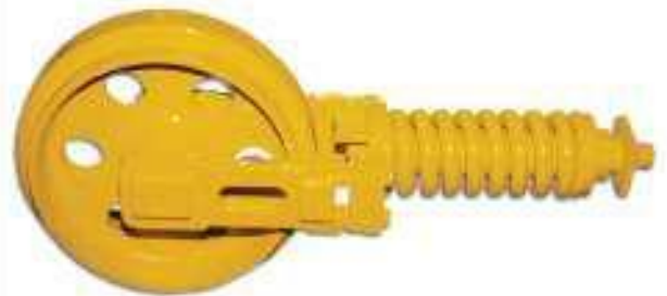
جهاز وسط الشد

Sprockets and rims for excavators are long-lasting and specifically designed to guarantee maximum reliability and performance in very tough operating conditions.