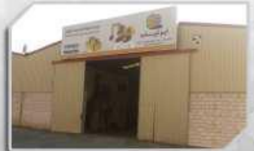
ورشة الصيانة MAINTENANCE WORKSHOP