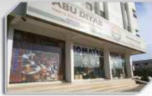
فروع أبها ABHA BRANCH