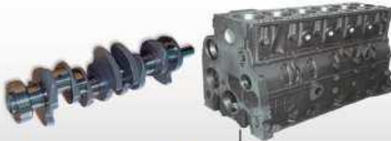
مكتبة المحرك مكتبة جديدة لبطانة الإسطوانات