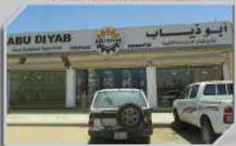
فروع الجوف AL JOUF BRANCH