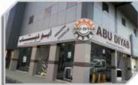
فروع صناعية خميس مشيط KHAMIS SINAYA BRANCH