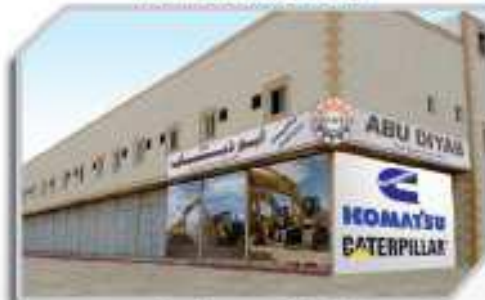
فروع الرياض - مخرج 18 RIYADH BRANCH EXIT - 18