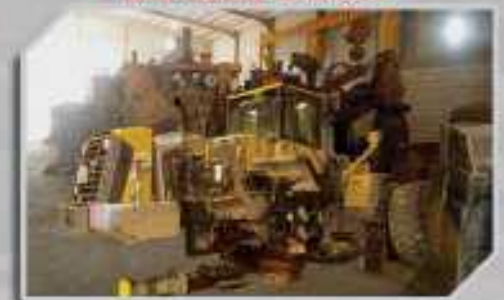
ورشة الصيانة MAINTENANCE WORKSHOP